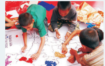
Durch die Förderung der URS können Kinder in Indien mit ausgebildeten Lehrern lernen.

Wir bezuschussen z.B. Lernmaterial, Stipendien oder Hilfen, die Kinder und Jugendliche in ihrem Lernverhalten und ihrer Persönlichkeit stärken.