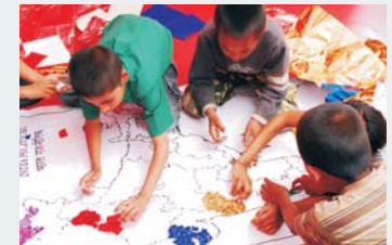
Durch die Förderung der URS können Kinder in Indien mit ausgebildeten Lehrern lernen.

Wir bezuschussen z.B. Lernmaterial, Stipendien oder Hilfen, die Kinder und Jugendliche in ihrem Lernverhalten und ihrer Persönlichkeit stärken.